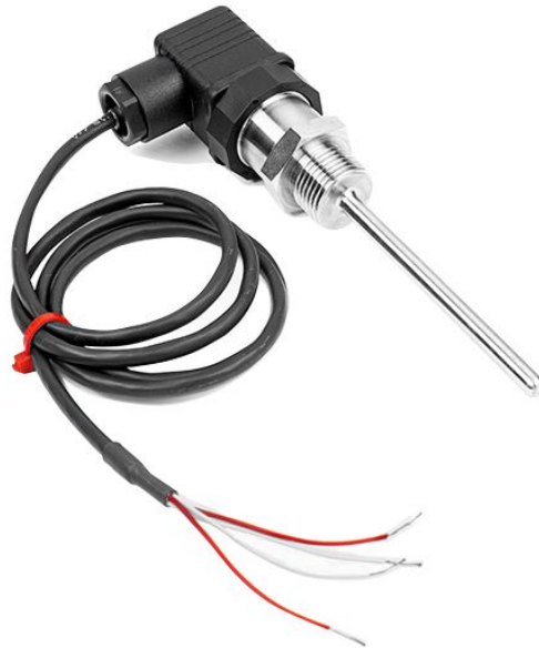
'HIRSCHMANN PT100 PROBE ASSEMBLY'